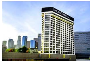
Double Tree by Hilton ホテル