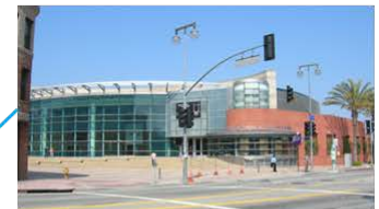
日系アメリカ人の国際博物館