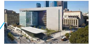
ロサンゼルス警察 (LAPD)