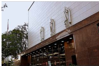
ロサンゼルス保安官