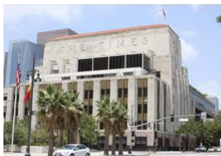
Los Angeles Times