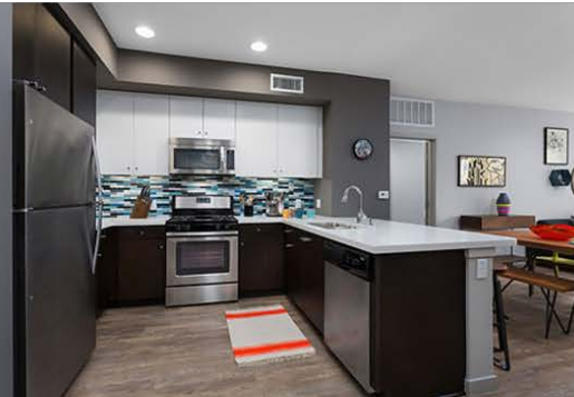
Kitchen and dining area in AVA Little Tokyo Apartment

ウエラーコートはロサンゼルスダウンタウンに新しく誕生した5つのアパート群に一番近くて、一番大きなショッピングセンターです。道のすぐ向こう側に住む6,000人の裕福でクリエイティブな若者をターゲットに、バンテージはホームブランドの商品を拡大中です。