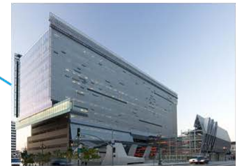
ロサンゼルス交通局