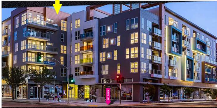
AVA Little Tokyo Apartment